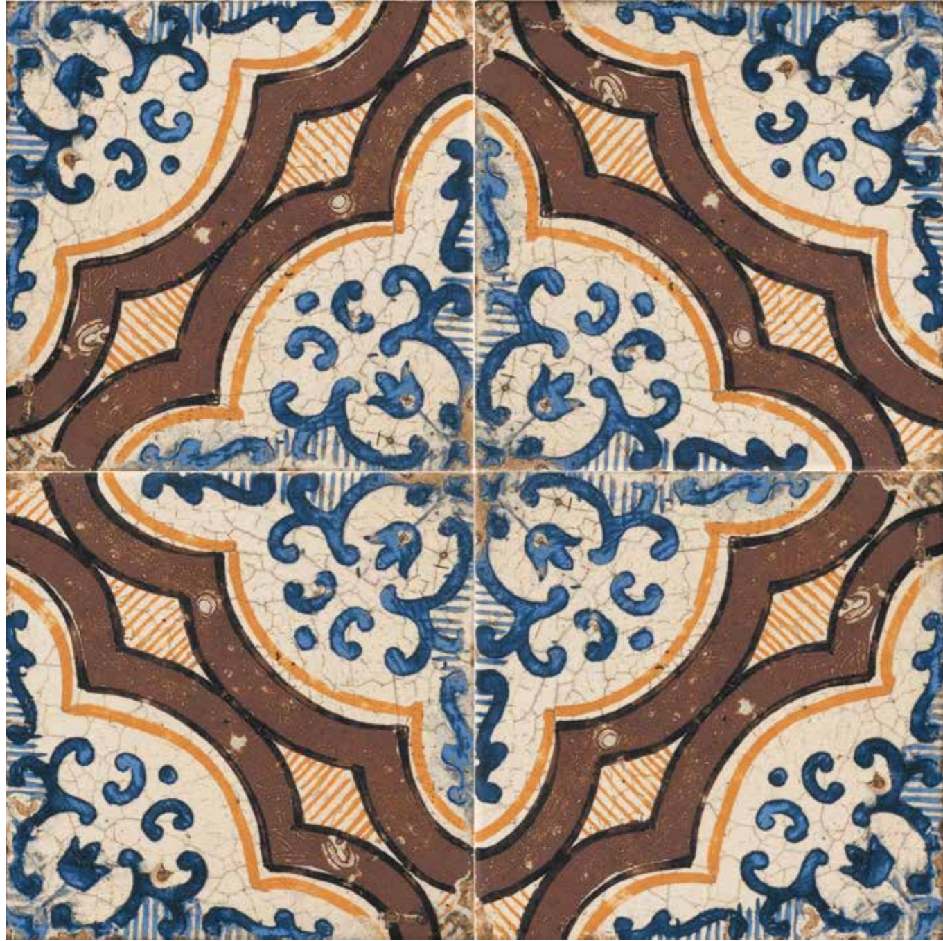
Casino di Monsignore