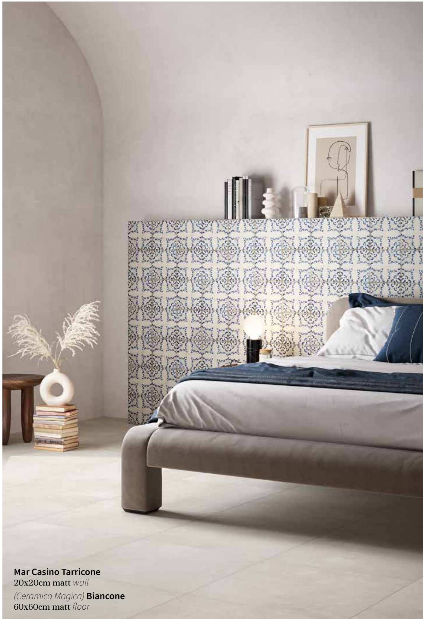
Mar Casino Tarricone 20x20cm matt wall (Ceramica Magica) Biancone 60x60cm matt floor