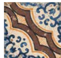
Casino di Monsignore