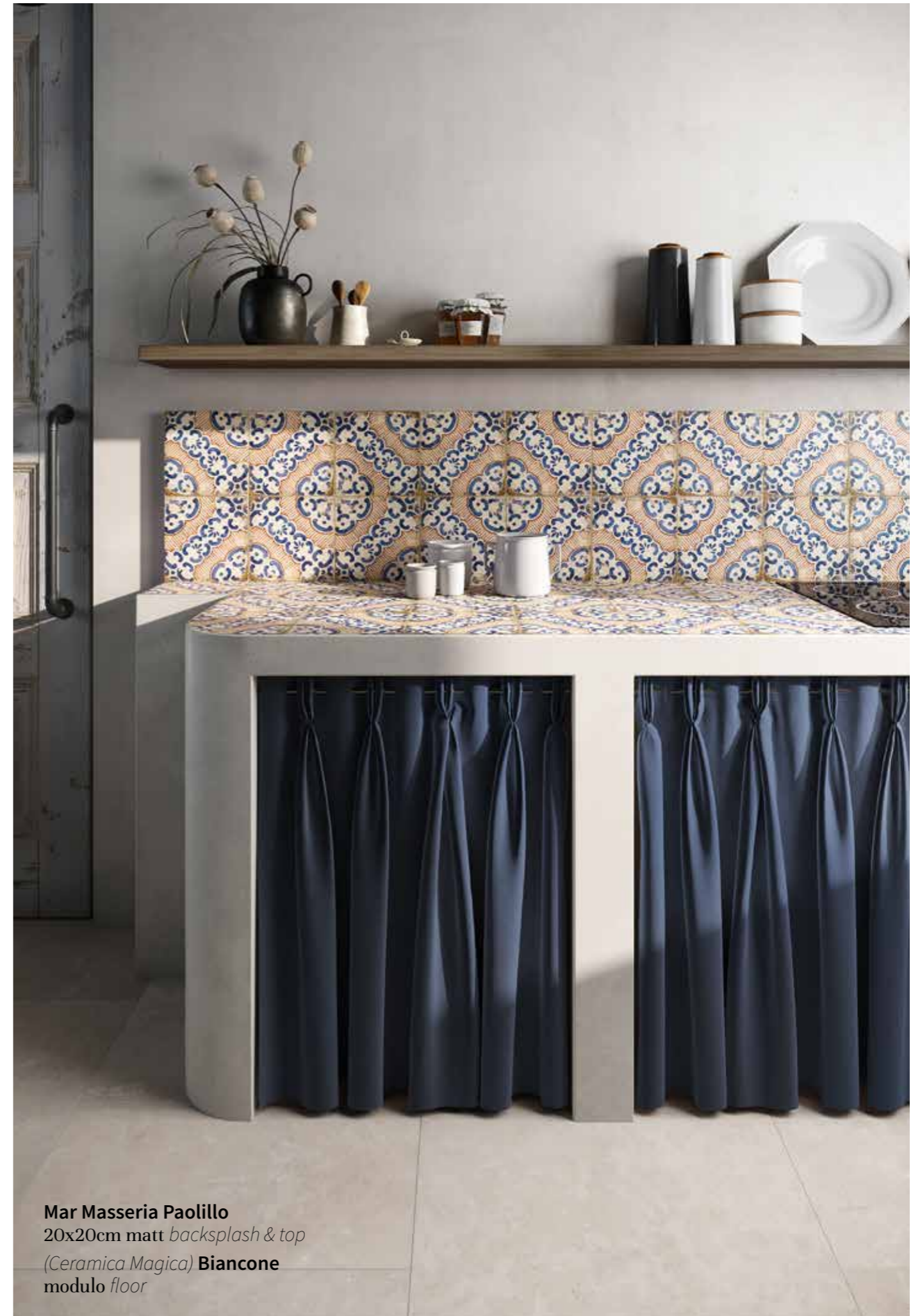
Mar Masseria Paolillo 20x20cm matt backsplash & top (Ceramica Magica) Biancone modulo floor