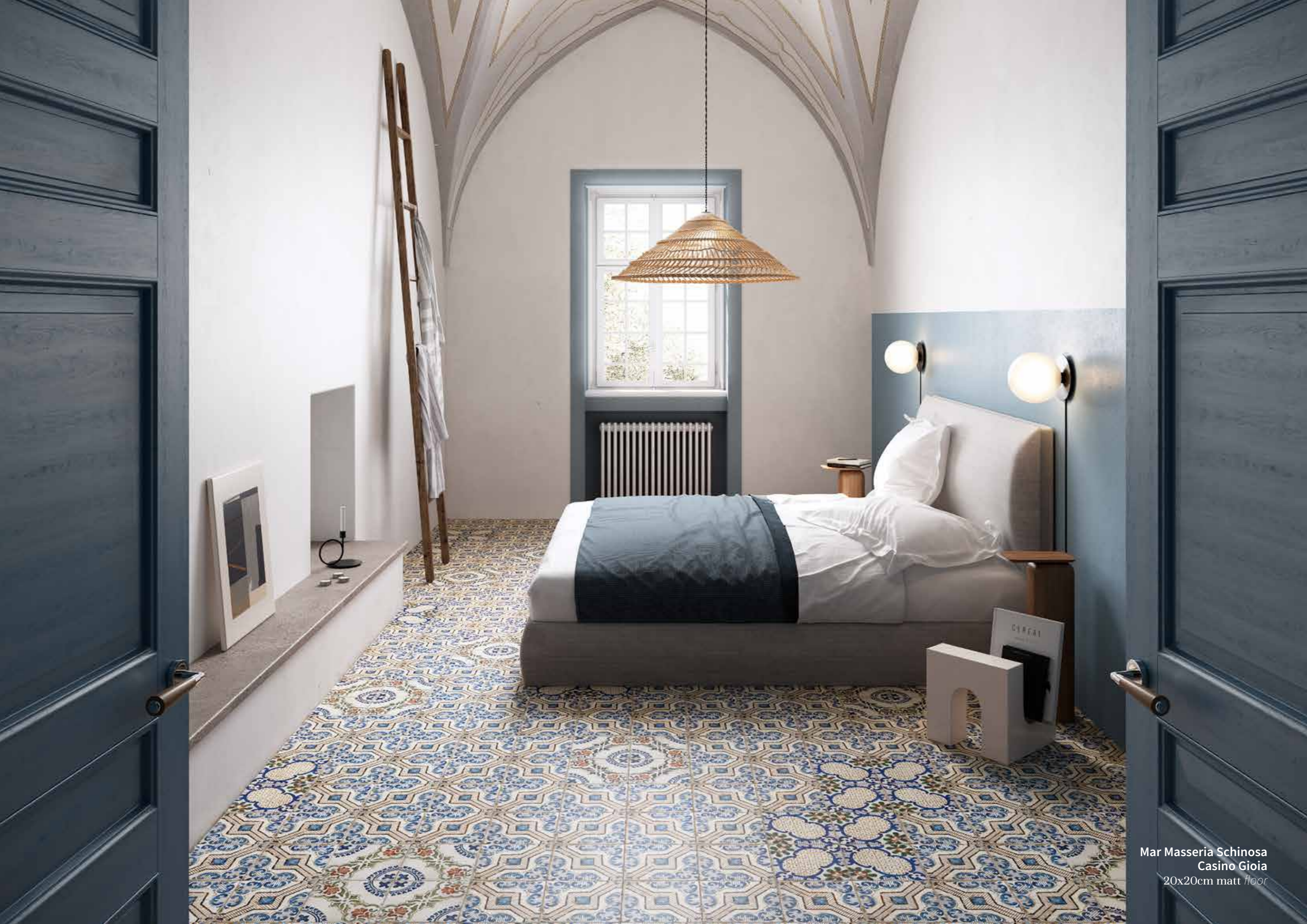
Mar Masseria Schinosa Casino Gioia 20x20cm matt floor